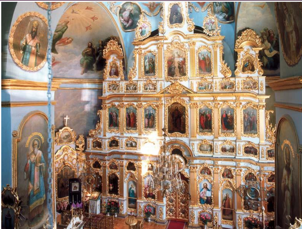
Іконостас у церкві Воздвиження Чесного Хреста Києво-Печерської Лаври

Повний традиційний іконостас має понад 50 ікон.